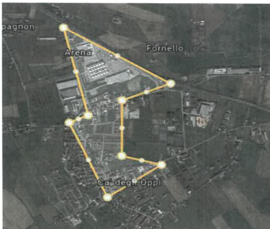
(perimetrazione frazione di Cà degli Oppi di Oppeano)