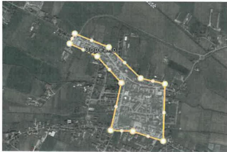
(perimetrazione Oppeano capoluogo)